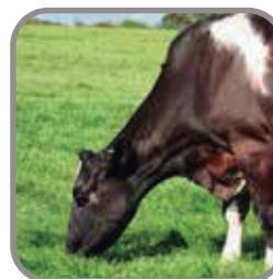
Función de Pesaje de Animales